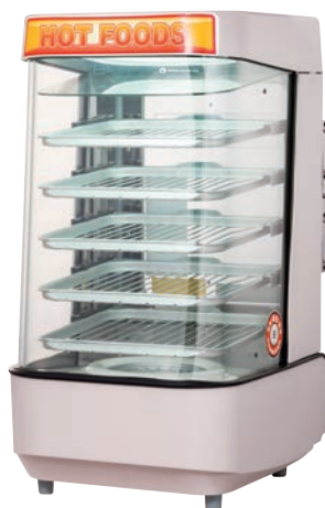
納期直B ⑤スチームマスター MJ45AL 77