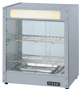
納期直B ①ホットショーケース NH-205 77