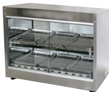
納期直B ④TBホットショーケース TBHS-600S 74

商品を早く効果的に蒸し上げ、蒸気を発生させながら保温しますので、中華まん等の店頭販売に最適です。